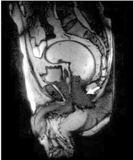
Fig. 2. MR defecography in patient with constipation. Prominent anal sphincter hypertrophy was noted (white arrow).

고하여 대장통과시간검사와 배변조영술은 보완적임을 주장하였고, 51 Yang 등은 배변조영술의 유형에 따라 바이오피드백 치료 결과의 예측 인자가 될 수 있다고 하였다. 52 또한 Chung 등은 만성 기능성 변비 환자에서 동적 MR 배변조영술의 유용성에 관하여 보고한 바가 있다(Fig. 2). 53